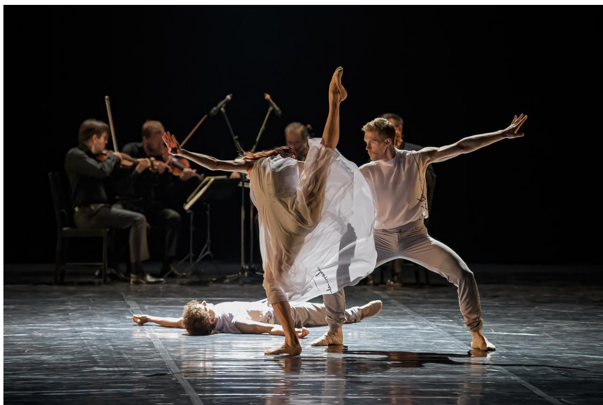
Listy důvěrné