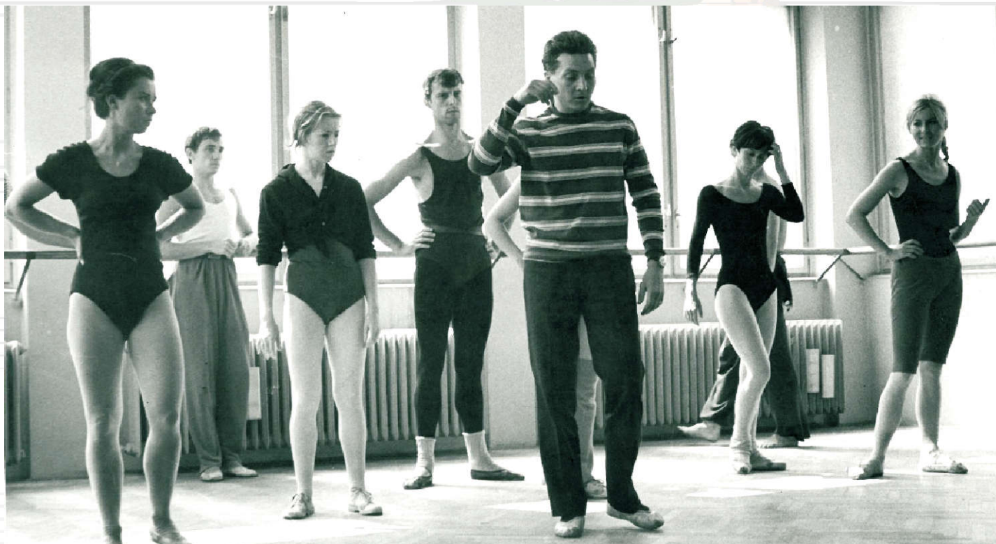
na kžubebrim šole

1964 - 1970 STUDIO BALET PRAHA - UMĚLECKÝ SOUBOR BALET PRAHA 1964 - 1970 STUDIO BALLET PRAGUE - ARTISTIC ENSEMBLE BALLET PRAGUE