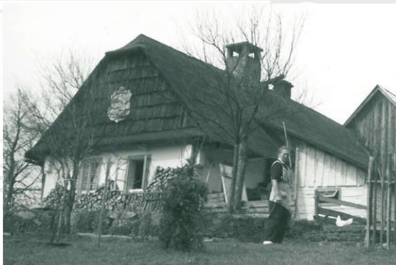
chalupa Šmoků v Nekorži