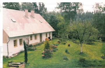
dnešní Nekorž č.p. 2/4