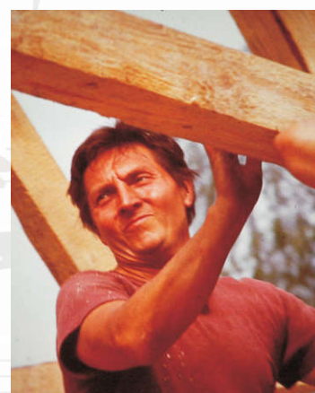
... řemeslo má zlaté dno