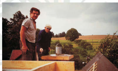
... s starínkem