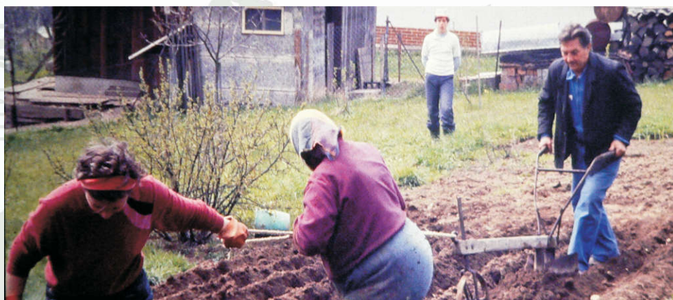
... hluboká orba rodné hroudě