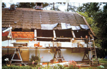
... restařovní umělec na síleše